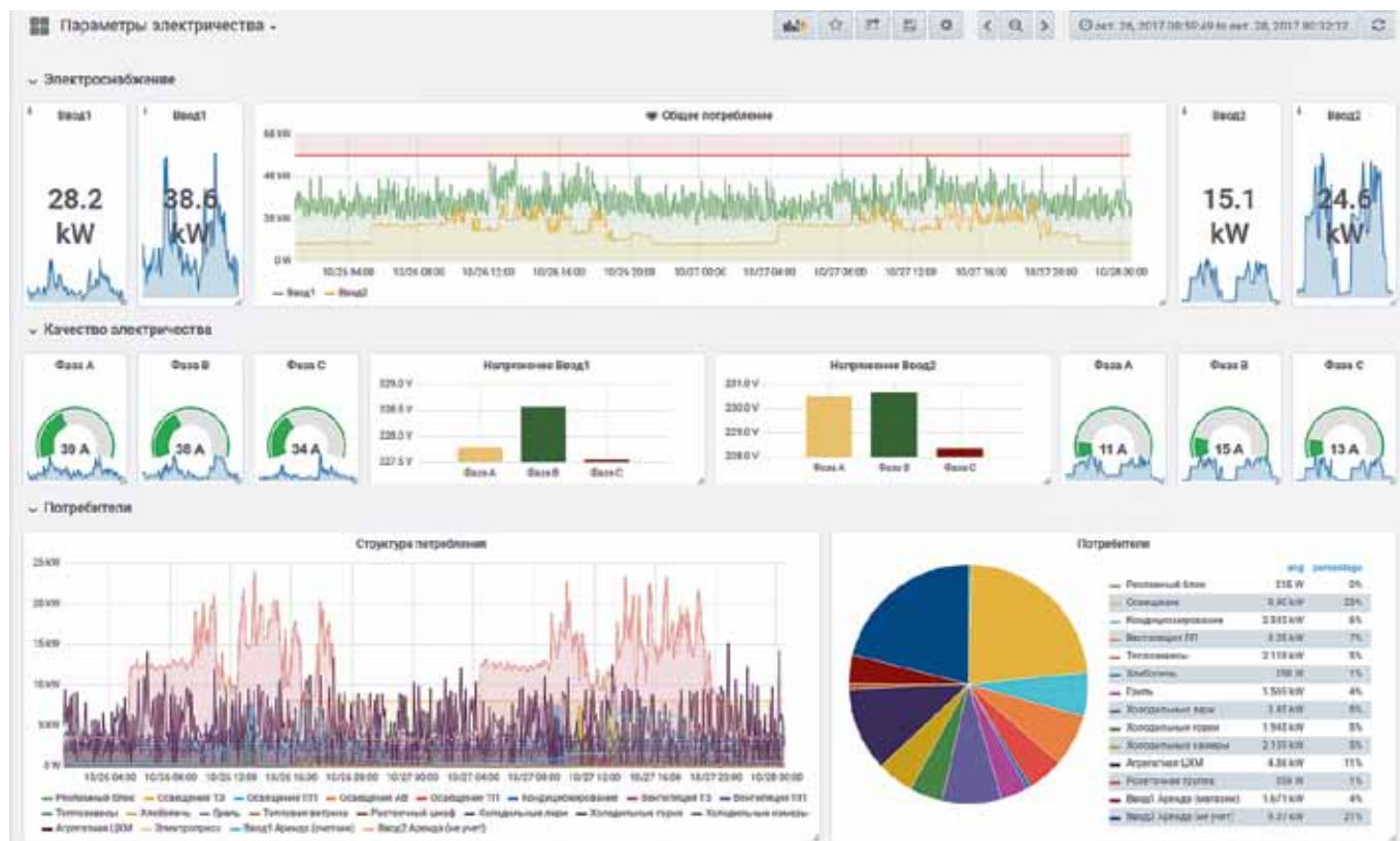
Рис. 3. Интерфейс системы мониторинга на базе оборудования Wiren Board и открытого ПО Grafana

Эта настройка обязательна для получения высокой точности: каждый канал настраивается на определенный датчик тока. Для каждого трансформатора тока нужно заполнить два параметра: коэффициент трансформации