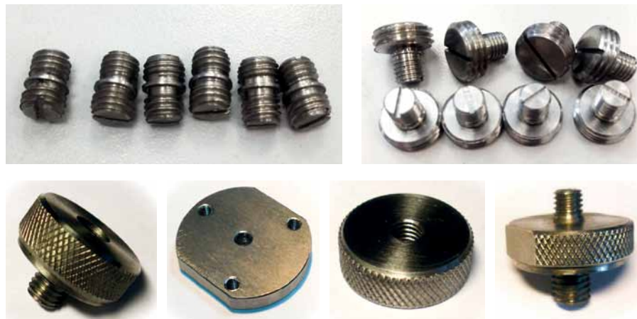
Рис. 3. Резьбовые адаптеры

Обычно для крепления вибродатчиков используются крепежные адап-