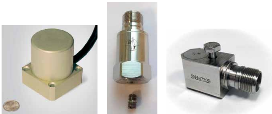
Рис. 2. Вибродатчики с разными точками крепления

стотной области. Как правило, такой спад характеристики определяется встроенной электроникой датчика. Тем не менее при использовании связанных по переменному току преобразователей сигналов и устройств считывания, имеющих входное полное сопротивление менее 1 МОм, эффект может сказываться и в низкочастотном диапазоне.