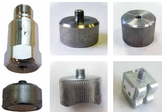
Рис. 5. Магнитные адаптеры для установки вибродатчиков

и там же обратите внимание на стопорение резьбы, предотвращающее самооткручивание при продолжительной вибрации.