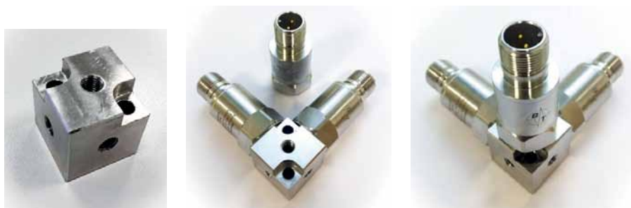
Рис. 4. Адаптер для измерения вибрации по двум/трем осям