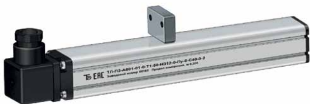
Рис. 6. Магнитострикционный датчик линейных перемещений ТЛ-ПЗК