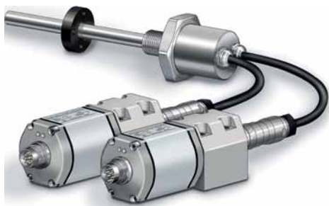
Рис. 2. Датчик серии ТЛ-С2Р2 с раздельной конструкцией

ТЛ-СФ1Б (рис. 4) разработан для замены индукционных (LVDT) датчи-