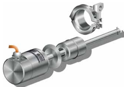
Рис. 5. Датчик ТЛ-С1С с соединением TriClamp