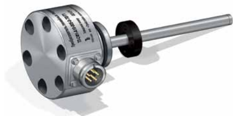
Рис. 4. Магнитострикционный датчик линейных перемещений ТЛ-СФ1Б