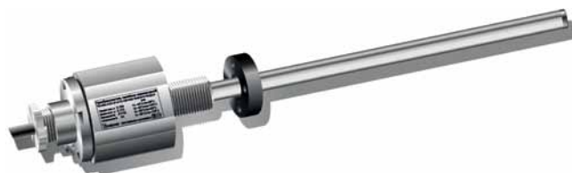
Рис. 3. Взрывозащищенный магнитострикционный датчик линейных перемещений ТЛ-СВ4