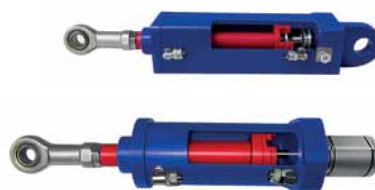
Рис. 7. Примеры установки магнитострикционных датчиков

ков перемещения и выполнен с фланцем стандарта Micro-Epsilon, что упрощает модернизацию существующих узлов.