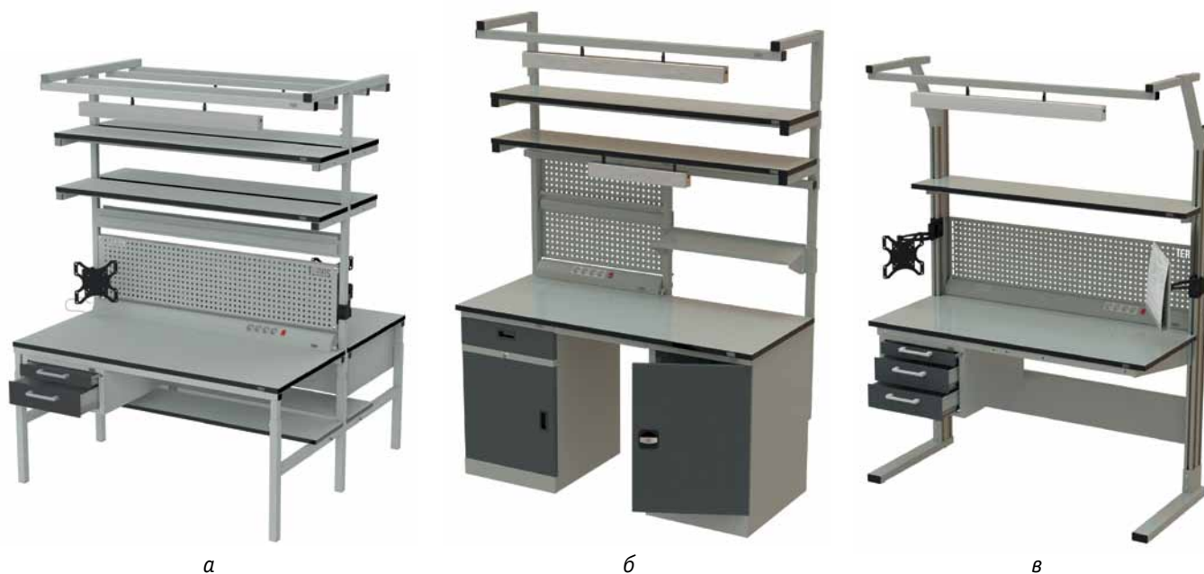
Рис. 2. Рабочие столы TERAS разных серий: а – DUAL; б – SOLID; в – MODERN

элементы быстро и без повреждений. Специальные бортики, устанавливаемые на столешнице и полках, ограничивают рабочие поверхности по периметру, не давая деталям падать. Кроме того, столы оснащены рулонными держателями – верхним, нижним и боковыми.