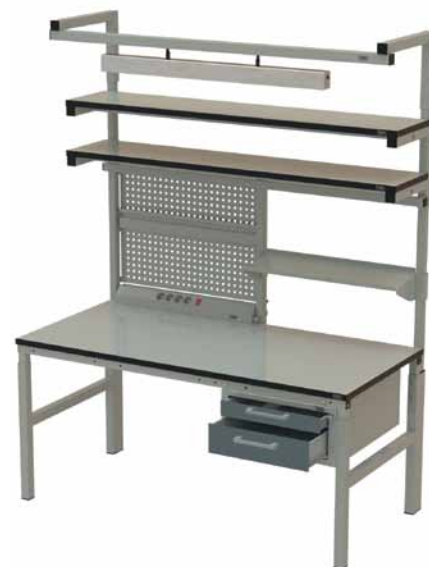
Рис. 1. Многофункциональный рабочий стол серии BASE: пример комплектации

На таком рабочем месте можно установить любое количество дополнительных комплектующих и аксессуаров – это предусмотрено конструкцией стола. Резьбовые муфты, встроенные в столешницу, позволяют монтировать и демонтировать разные