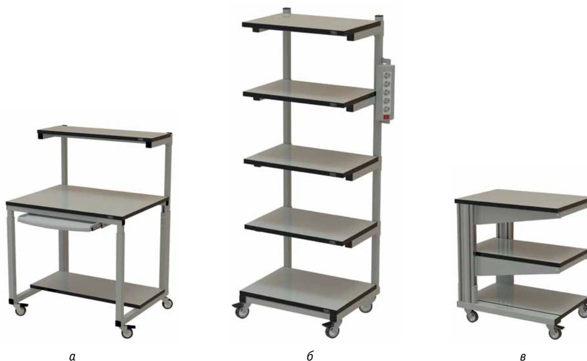
Рис. 3. Подкатная мебель TERAS: а – компьютерный стол; б – стойка; в – подкатный стол Modern

ADVANCED (рис. 2). Они могут различаться количеством рабочих мест (например, в столах DUAL два зеркально расположенных рабочих места), размерами и крепостью столешницы (так, в столах SOLID предусмотрена повышенная нагрузка на столешницу), высотой ее регулировки, разными типами опор (у столов MODERN в качестве опор и стоек служит профиль из анодированного алюминия), аксессуарами. Для каждой серии предназначен широкий