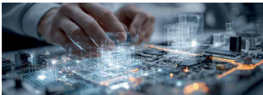
Рис. 3. Дефицит ЭКБ: отечественные печатные платы и микроконтроллеры фактически недоступны в нужных рыночных объемах

мулировании выполнения наиболее ценных и сложных технологических операций, которые обеспечивают реальный технологический суверенитет и добавленную стоимость.