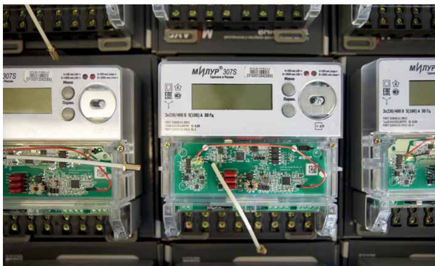
Рис. 2. Отечественные приборы учета электроэнергии

А производителям счетчиков должно быть выгодно применение отечественных компонентов в серийном производстве приборов учета, действовать необходимо не на уровне запретительных мер, а на уровне создания реальных предпочтений.