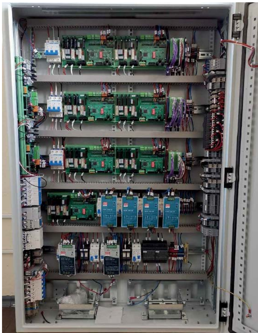
Рис. 1. Наполнение шкафа автоматики навесного УШАМ.65.12x8

На верхнем уровне системы выполняются задачи координации и оптимизации, расчет технико-экономических показателей. Здесь можно использовать контроллеры верхнего уровня PC2xx под ОС на базе ядра Linux для координации работы контроллерных узлов, управляющих отдельными агрегатами. Но применение таких ПЛК необязательно. Как отмечалось выше, в небольших системах