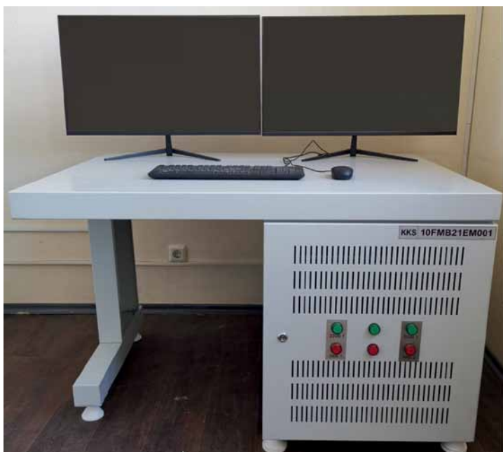
Рис. 2. АРМ одноместный однотумбовый УШАП.21.12

модули ввода/вывода могут выходить напрямую на АРМ оператора, которые выполняют функции как собственно АРМ, так и, например, архивных серверов (рис. 2).