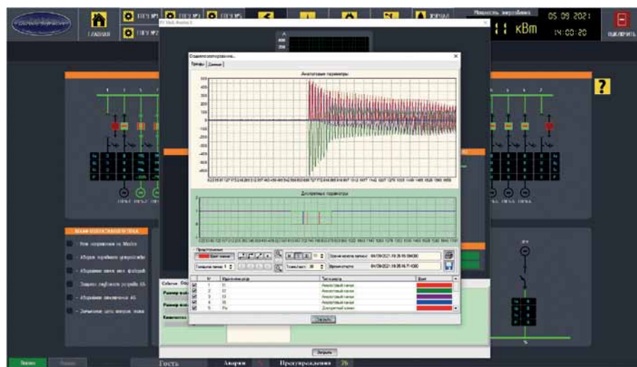
Рис. 2. SCADA TechnoSoft: окно работы с осциллограммами