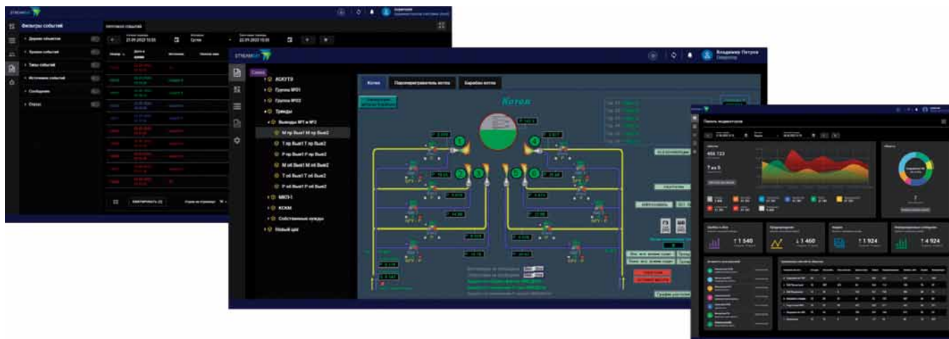
Рис. 1. Интерфейсы среды исполнения StreamDat

рических данных (тренды, протоколы событий) из разных источников упрощает мониторинг и дает полную картину текущих процессов на предприятии.