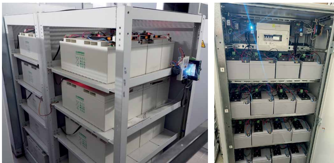
Рис. 2. Примеры инсталляции системы балансировки заряда на производстве

За прошедшие годы изделия ООО «НИП» прошли тестирование на предприятиях России и доказали свою эффективность. На рис. 2 показаны примеры внедрения: на первом фо-