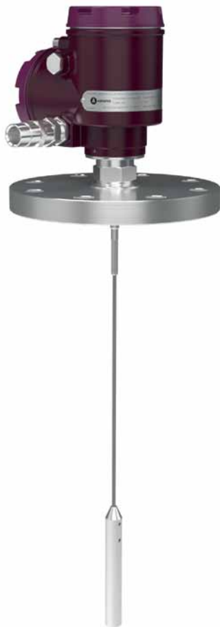
Рис. 2. Микроимпульсный уровнемер AVANTEK 7100

Работа уровнемеров серии 7200 основана на методе частотно-модулированной непрерывной волны (FMCW). Электронный блок прибора формирует измерительный импульс,