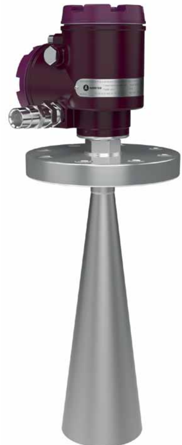
Рис. 3. Радарный уровнемер с рупорной антенной