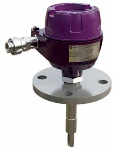
Рис. 1. Вибрационный сигнализатор уровня AVANTEK 2100

В линейке измерительных устройств группы «Симметрика» представлен вибрационный сигнализатор AVANTEK 2100 (рис. 1, табл. 1). Его