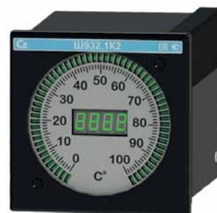
Рис. 5. Одноканальный круглошкальный прибор Ш932.1К2

Выпускаются в двух модификациях: для измерения силы и напряже-