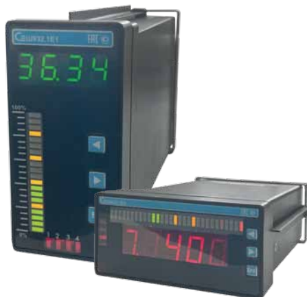
Рис. 2. Универсальные вторичные измерительные приборы Ш932.1Е

▶ Ш932.1У2 снабжен цифровым индикатором и дискретно-аналоговой