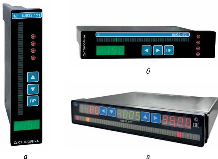
Рис. 4. Узкопрофильные вторичные приборы Ш932.1У разных конструктивных исполнений: а – Ш932.1У1; б – Ш932.1У2; в – Ш932.1У3

линейной шкалой. Горизонтальная ориентация лицевой панели, габариты по корпусу – 150 × 28 × 173 мм;