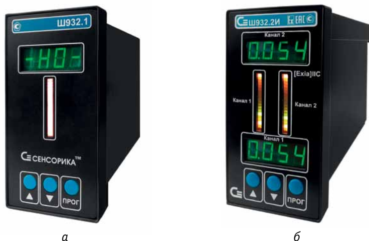
Рис. 1. Примеры вторичных измерительных приборов серии Ш932: а – Ш932.1; б – Ш932.2И