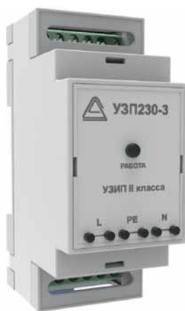
Рис. 5. УЗИП «Амадон» серии УЗП230

УЗИП ЗЛС-Д разработаны для защиты линий связи RS-485/422 (класс защиты III) и могут использоваться в системах промышленной связи для защиты КИП (в том числе в АСУ ТП). Выпускаются два исполнения: ЗЛС-1Д для одного канала RS-485, ЗЛС-2Д для двух каналов RS-485 или одного RS-422. Дополнительно реализованы отключаемый терминальный резистор сопротивлением 120 Ом и схема дренажа питания для соединения общего провода различных источников питания и заземления. ЗЛС-Д не имеют корпуса, состоят из пластиковых кронштейнов и печатной платы с компонентами.