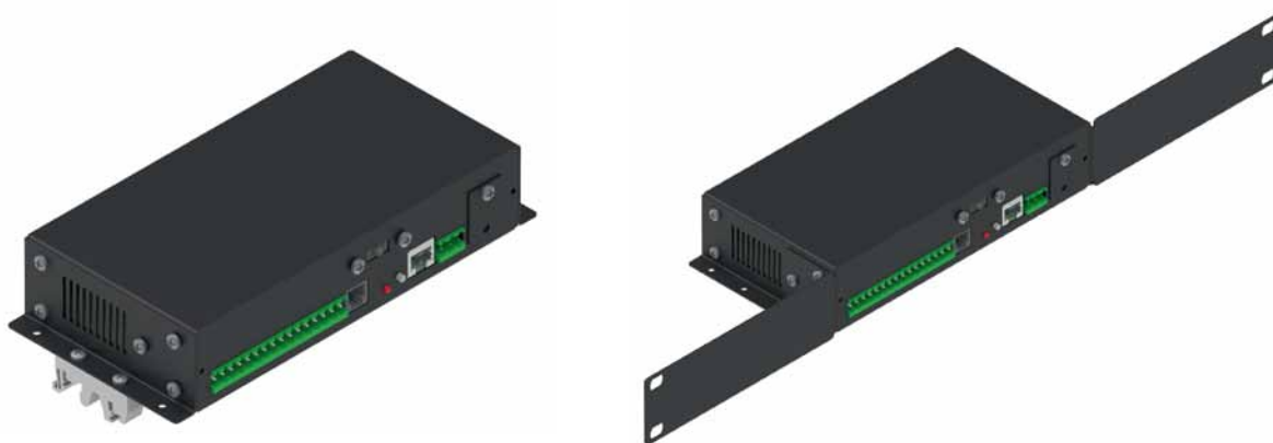
Рис. 3. Устройство мониторинга и управления УМА-5И с разными вариантами крепления

К другим преимуществам УМА-5И отнесем гибкую настройку внутренней логики, наличие промышленного исполнения с защитой входов и выходов с помощью оптоэлектронной изоляции, а также модификации УМА-5ИС с СМС-модулем для отправки сообщений о срабатывании. Питание от источника постоянного тока напряжением 12 В позволяет реализовать схему