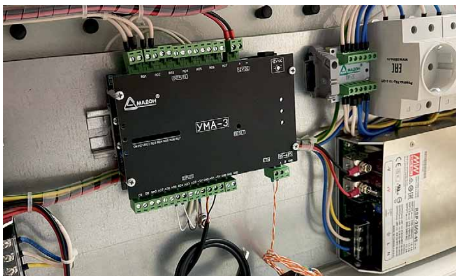
Рис. 2. Устройство мониторинга УМА, установленное в шкафу

предназначено для контроля состояния датчиков и управления работой исполнительных устройств, подключенных к системе. Через специальное приложение к его входным каналам можно привязать датчики разного типа, задать логику работы выходных каналов, настроить связь. Поддерживаются интерфейсы RS-485 или Ethernet, причем могут использоваться протоколы Modbus и SNMP. Список поддерживаемых датчиков обширен. Это могут быть датчики температуры, влажности, наличия напряжения, затопления, фотореле, датчики положения, охранные контуры. Такой список охватывает практически все потребности контроля параметров. Также к УМА подключаются кнопки, тумблеры и переключатели. Управление осуществляется через реле «сухой контакт» с током коммутации до 5 А. Управление мощной или высоковольтной нагрузкой возможно с помощью дополнительных реле и контакторов. В качестве исполнительных