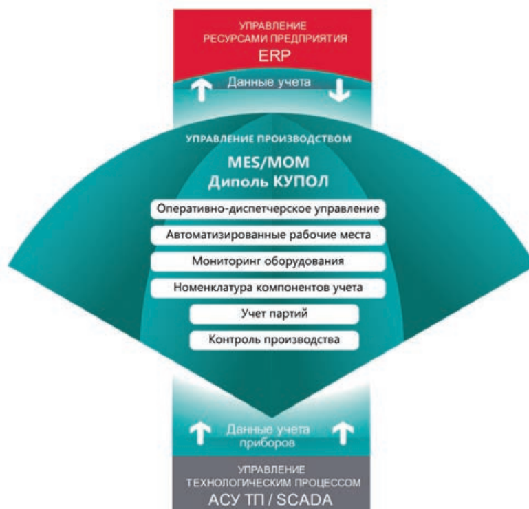
Рис. 1. ПАК «ДИПОЛЬ К.У.П.О.Л.» в системе управления производством

начала работу в 1992 году с поставок зарубежного и отечественного оборудования: радиоэлектроники, измерительной техники, оборудования для пайки. В девяностые годы зарубежные производители оккупировали российский рынок, поэтому многие занимались поставками, а не произ-