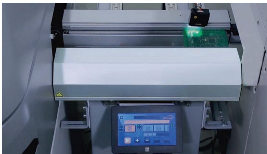
Рис. 2. Контроллер «Диполь СПУТНИК», установленный в конвейер

Какие же задачи выполняет MES-система на предприятиях радиоэлектронной отрасли, например, осуществляющих монтаж печатных плат? Для начала она позволяет создать автоматизированные рабочие места работников, выполняющих самые разные операции. Создание АРМ различного профиля — одно из конкурентных преимуществ этого решения! Данные,