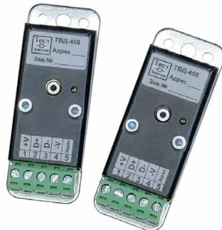
Рис. 3. Тепловизионные датчики ТВД-450

устройств и передавать данные сразу о нескольких объектах в контроллер системы «Зной».