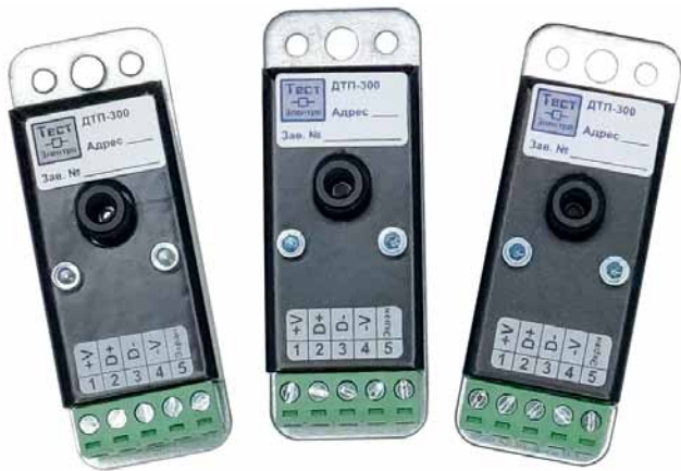
Рис. 2. Датчики температуры пирометрические ДТП-300

поверхность оборудования (рис. 4). Картинка 32 \times 32 пикселя на сегодня является одной из лучших для сравнимых вариантов исполнения. Более того, в релейный шкаф устанавливается модуль «Зной» с тремя релейными каналами, и к одной шине можно подключить до 10 датчиков ТВД-450.