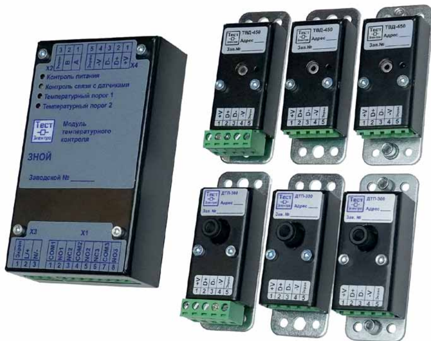
Рис. 1. Система «Зной» с датчиками ДТП-300 и ТВД-450

ка» электроснабжения – кусочек парафина на диэлектрической штанге, плавление которого определяло температуру от 65 до 90 °С в зависимости от состава, регистрируют только аварийную температуру с немедленным отключением. Это касается в том числе и вполне современных систем, например с газогенерирующими клеевыми этикетками и газоанализатором.