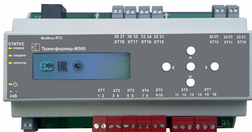
Рис. 3. Промышленный контроллер «Трансформер-М500»

Автоматика ООО «ЭТК-Прибор» и автоматизированные системы, разработанные ее специалистами, широко используются на объектах Москвы