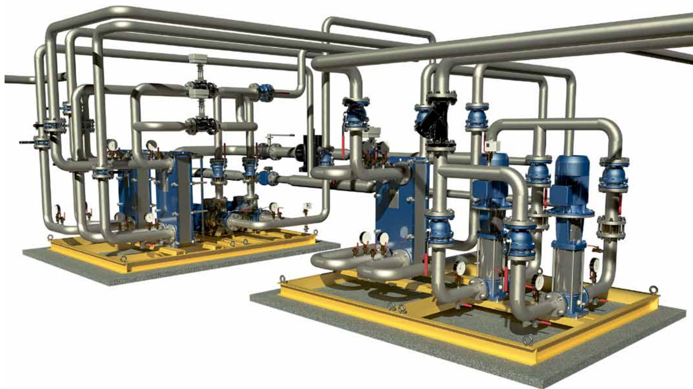
Рис. 1. Блочный тепловой пункт «ЭТК-Прибор»

вые сети и котельные. Будучи готовым комплексным решением, БТП может использоваться самостоятельно, но может и интегрироваться с автоматизированными системами учета и распределения тепловой энергии, включающими в свой состав несколько тепловых пунктов.