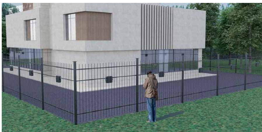
Рис. 3. Пример установки вибрационных датчиков системы Triboniq™

(свыше 15 км), так и базовая система для малых охраняемых зон.