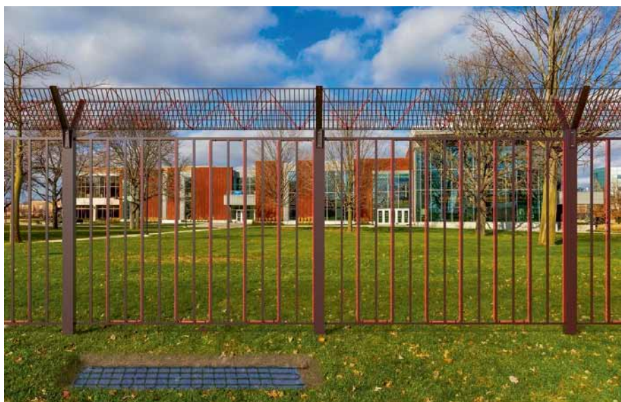
Рис. 2. Система Triboniq™: примеры установки трибоэлектрического кабеля