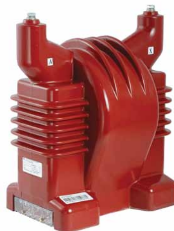
Рис. 5. Трансформатор напряжения НОЛ-НТЗ-27.5 с номинальным напряжением первичной обмотки 27,5 кВ

на тяговых подстанциях в электросетях КРУ 25 кВ и 2×25 кВ. Ранее там применялись измерительные трансформаторы напряжения с классической заземляемой конструкцией. Их применение сопровождалось массовыми выходами из строя, что приводило к остановке оборудования и движения поездов. Использование новых трансформаторов позволило полностью исключить такие случаи. Там, где выходили из строя десятки трансформаторов в год, в том числе лучших мировых брендов, теперь, уже более 6 лет безотказно работают измерительные трансформаторы НОЛ-НТЗ-27.5 производства «НТЗ «Волхов».