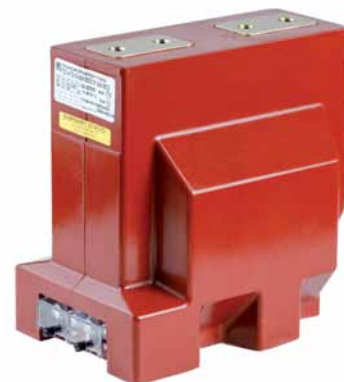
Рис. 1. Малый измерительный трансформатор тока ТОЛ-НТЗ-10-02

Измерительные трансформаторы тока для работы в переходных режимах были разработаны специально для российских энергосетей, чтобы гарантировать их устойчивую работу в условиях возникающих переходных режимов, связанных с воздействием токов коротких замыканий. Раньше апериодическая составляющая тока, появляющаяся в переходных режи-