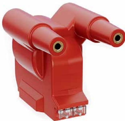
Рис. 4. Силовой трансформатор малой мощности ОЛС(П)-НТЗ-0,25(0,63)/6(10): тип присоединения РИКС

Наиболее компактными являются силовые трансформаторы малой мощности ОЛС(П)-НТЗ-0,25(0,63)/6(10), их масса не превышает 26 кг (рис. 4). Такие трансформаторы тоже являются комплектующим изделием для КРУ и КСО, но в отличие от аналогов могут применяться в малогабаритном оборудовании. Выводы первичной обмотки трансформаторов ОЛС(П)-НТЗ-0,25(0,63)/6(10) выполнены по технологии подключения РИКС и позволяют использовать кабельный монтаж внутри ячейки, благодаря чему сокращаются габариты всего сборного изделия.