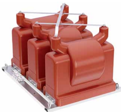
Рис. 3. Силовой трансформатор ТЛС-НТЗ-40-6(10)

Трансформаторы малой мощности в настоящее время – один из наиболее востребованных типов трансформаторов. Они находят применение в самых разных устройствах любых отраслей электросетевого комплекса. В частности, в их число входят трехфазные силовые трансформаторы мощностью 40 кВА ТЛС-НТЗ-40-6(10), обеспечивающие питание цепей собственных нужд оборудования электрических се-