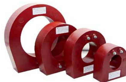
Рис. 2. Измерительные трансформаторы токов нулевой последовательности ТЗЛК-НТЗ-МЗ

мах, приводила к насыщению обмоток трансформатора и потере его функциональных возможностей, а значит, и к сбоям в системах автоматики и за-