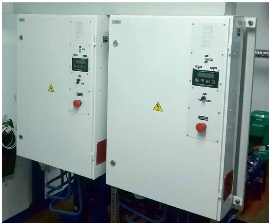
Рис. 1. Тиристорный регулятор переменного напряжения серии ТРМ в котельной

ТРМ (рис. 1) — базовая модель линейки и прекрасное решение по соотношению цены и качества на российском рынке. Это полностью готовое устройство, для его установки не требуются дополнительные затраты на приобретение шкафа и других ком-