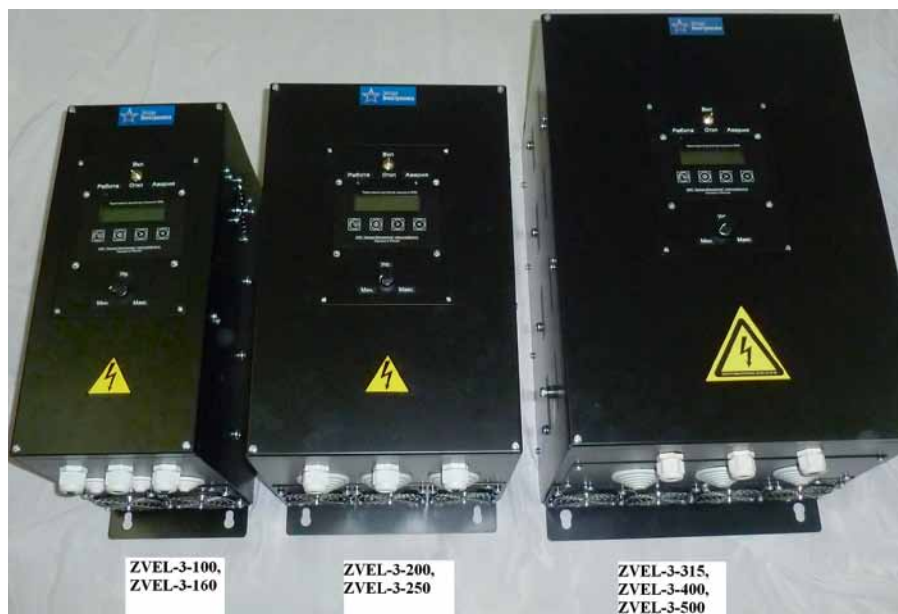
Рис. 3. Тиристорные регуляторы серии ZVEL

ТВН-3-LC оснащен сглаживающим индуктивно-емкостным фильтром.