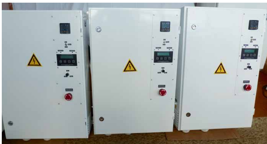
Рис. 2. Регуляторы модификаций ТРМ-3-ПИД-160

плектующих, на монтаж цепей внутри шкафа и т. д. Регуляторы ТРМ отвечают всем современным требованиям к устройствам подобного класса, имеют развитую систему настроек, защит и автодиагностики, хорошо работают как с активной, так и с индуктивной нагрузкой. Схемы подключения нагрузки: «звезда», «треугольник», «звезда с нейтралью», «разомкнутый треугольник».