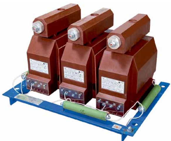
Рис. 3. Трехфазная группа из трех заземляемых трансформаторов напряжения ЗНОЛП-ЭК на раме

группы трансформаторов, использующиеся в составе КРУ и КСО наружного и внутреннего исполнений, обеспечивают электропитание самых разных сетевых устройств, включая приборы учета электроэнергии и автоматику.