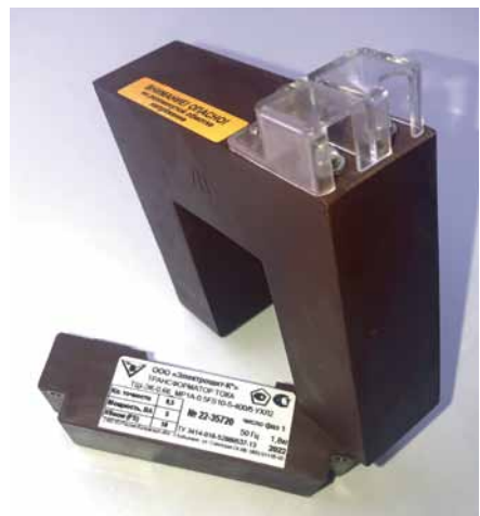
Рис. 2. Шинный измерительный трансформатор тока ТШ-ЭК-0,66 МР1 А