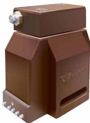
Рис. 4. Однофазный силовой трансформатор напряжения серии ОЛСП-ЭК

Еще одна популярная линейка данной продукции – однофазные силовые трансформаторы напряжения серии ОЛСП-ЭК (рис. 4) с предохранительным устройством с литой изоляцией. Они не являются измеритель-