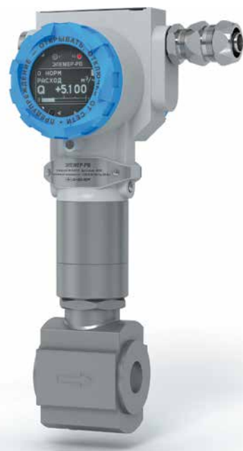
Рис. 5. Вихревой расходомер ЭЛЕМЕР-РВ

Кроме того, разработка нового прибора предусматривает расчет отказоустойчивости работы внутренней