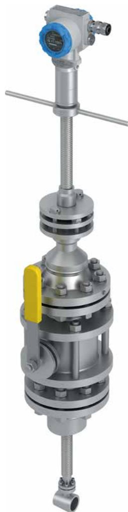
Рис. 7. Расходомер ЭЛЕМЕР-РВ зондового типа

Также НПП «ЭЛЕМЕР» производит экономичное решение для измерения расхода газообразных сред и жидкостей в трубопроводах большого диаметра. ЭЛЕМЕР-РВ зондового типа (рис. 7) разработаны в типоразмере Ду 100...2000 с индексом