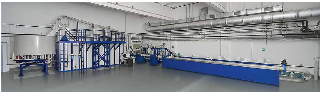
Рис. 9. Жидкостная эталонная установка НПП «ЭЛЕМЕР»

счетчики, так и большие многоканальные измерительные системы с поддержкой десятка трубопроводов. В качестве первичных преобразователей могут применяться диафрагмы с угловым, фланцевым, трехрадиусным способами отбора давления по ГОСТ 8.586.2-2005, сопла ИСА 1932 и сопла Вентури по ГОСТ 8.586.3-2005, диафрагмы с угловым способом отбора давления и сопла ИСА 1932 по МИ 3152-2008, осредняющие напорные трубки (ОНТ) по МИ 2667-2011.