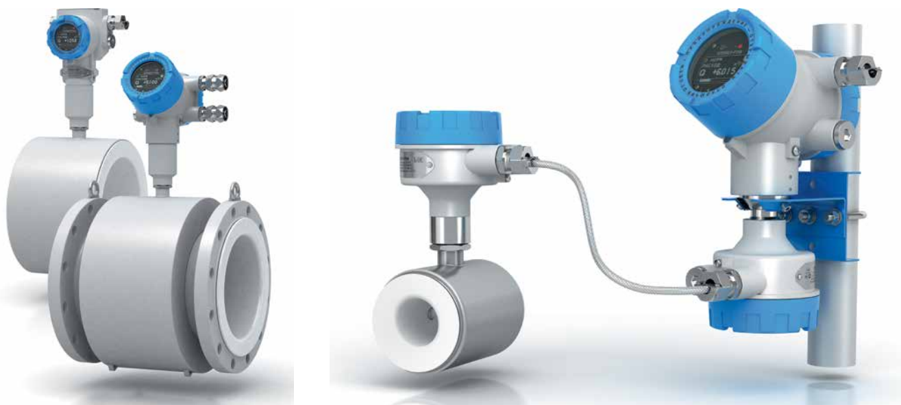
Рис. 1. Расходомеры-счетчики электромагнитные ЭЛЕМЕР-РЭМ разных исполнений

На протяжении нескольких лет серийно выпускается большая линейка расходомеров-счетчиков ЭЛЕМЕР-РЭМ (рис. 1). Эти расходомеры оснащены адаптивной системой контроля уровня полезного сигнала, OLED-экраном, поддерживают все основные выходные сигналы. Специальная конструкция магнитопровода предусматривает полную заливку компаундом, что повышает его виброустойчивость. Набор электродов и футеровок из различных материалов гарантирует стабильную работу приборов в суровых климатических условиях (при температурах до -60^{\circ}\text{C} ) при измерении расхода воды, кислот, щелочей или абразивных сред. Расходомеры-счетчики