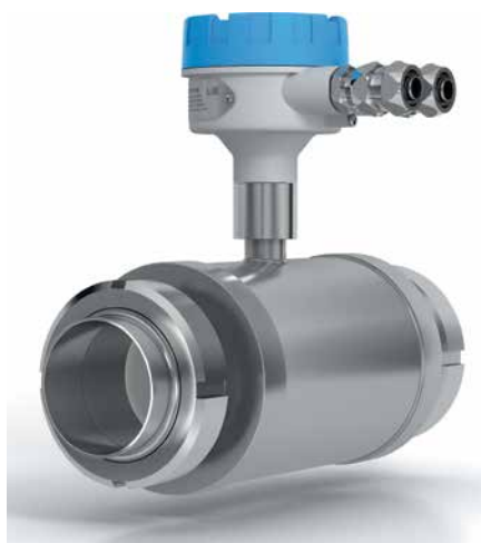
Рис. 2. Электромагнитный расходомер ЭЛЕМЕР-РЭМ с гигиеническим присоединением

Вопрос быстрой интеграции новой аппаратуры в существующие АСУ ТП особенно остро стоит на предприятиях с непрерывными режимами работы и большим количеством ответственных участков, где остановка процессов имеет критический характер. Теперь крупным предприятиям будет значительно проще произвести интеграцию расходомеров ЭЛЕМЕР-РЭМ на базе блоков преобразования расхода