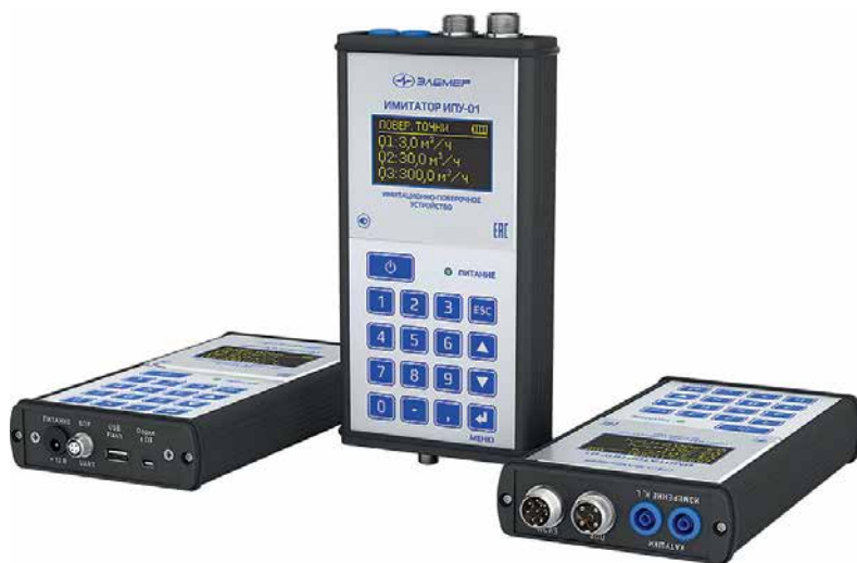
Рис. 3. Имитационно-поверочное устройство ИПУ-01

Для поддержки удаленных объектов эксплуатации и решения вопроса о поверке приборов в затрудненных условиях разработано имитационно-поверочное устройство ИПУ-01 (рис. 3), предназначенное для имитационной бездемонтажной поверки электромагнитных расходомеров продуктовой линейки ЭЛЕМЕР-РЭМ. Имитатор ИПУ-01 применяется прежде всего на удаленных технологических объектах, находящихся вдали от метрологических центров, а также в случае отсутствия возможности остановки процесса и (или) демонтажа приборов, при коротком технологическом окне для поверки расходомеров. Отличительными свойствами продукта являются: высокая точность воспроизводимой величины электрического напряжения, имитирующего выходные сигналы первичного преобразователя расходомера; наличие сменного блока балластных резисторов для обеспе-