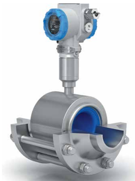
Рис. 4. Расходомер-счетчик электромагнитный ЭЛЕМЕР-РЭМ ППД

Традиционной для всей линейки расходомеров ЭЛЕМЕР-РЭМ является универсальная схмотехническая платформа на основе электронных модулей среднего и верхнего уровней, расположенных во взрывозащищен-