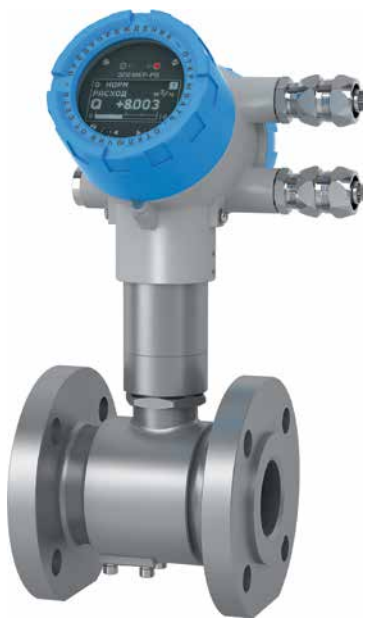
Рис. 6. Вихревой расходомер ЭЛЕМЕР-РВ с блоком преобразования расхода БПР-02М1

схемотехники и сертификацию расходомера на соответствие требованиям ГОСТ Р МЭК 61508 и ГОСТ Р МЭК 61511 в части уровня полноты безопасности УПБ 2 для включения прибора в контуры систем противоаварийной защиты (ПАЗ).