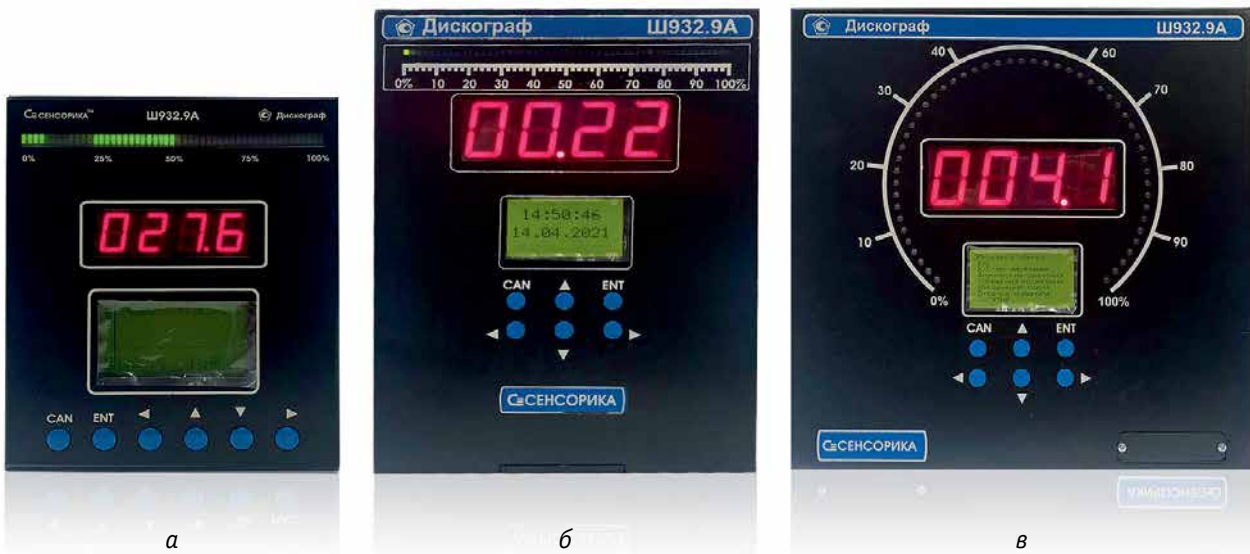
Рис. 1. Конструктивное исполнение видеографического регистратора Ш932.9А-29.010 «Дискограф»: а – 29.010/3 (в габаритах КП1); б – 29.010/2 (в габаритах КСМ, КСП); в – 29.010/1 (в габаритах ДИСК 250)

можно использовать для сигнализации и управления (регулирования).