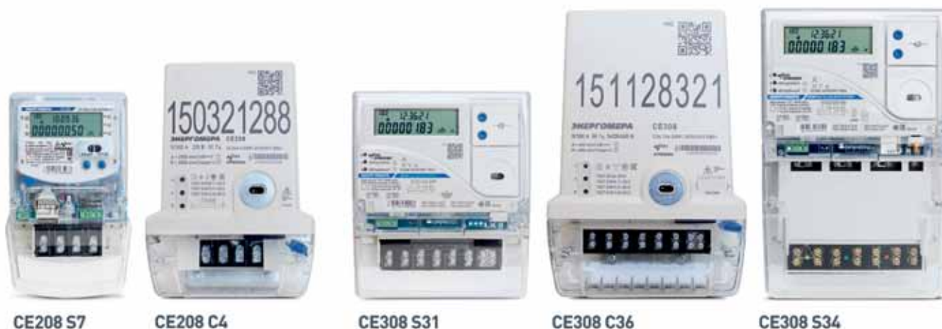
Рис. 2. Приборы учета линейки СПОДЭС с гибридным каналом связи: CE208 S7, CE208 C4 – однофазные многотарифные; CE308 S31, CE308 C36, CE308 S34 – многофазные многотарифные

кие заводы «Энергомера» разработала и внедряет систему, построенную на гибридном канале связи PLC + RF (рис. 1). В Mesh-сети, где все устройства работают в непрерывном взаимодействии, выбирая оптимальный маршрут для передачи данных, гибридная система позволяет им выбрать на каждом участке маршрута среду передачи данных с лучшими показателями. Например, при возникновении препятствий на пути радиосигнала данные передаются по G3-PLC. А при наличии мощных импульсных помех в ЛЭП обмен происходит по радиоканалу. Причем перестроение сети трансляции выполняется автоматически.