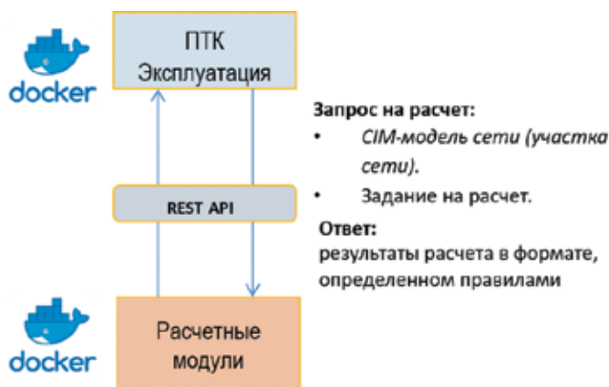
Рис. 2. Использование открытой микросервисной архитектуры