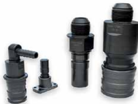
Рис. 3. Быстроразъемные гидравлические соединители типа СЖ2