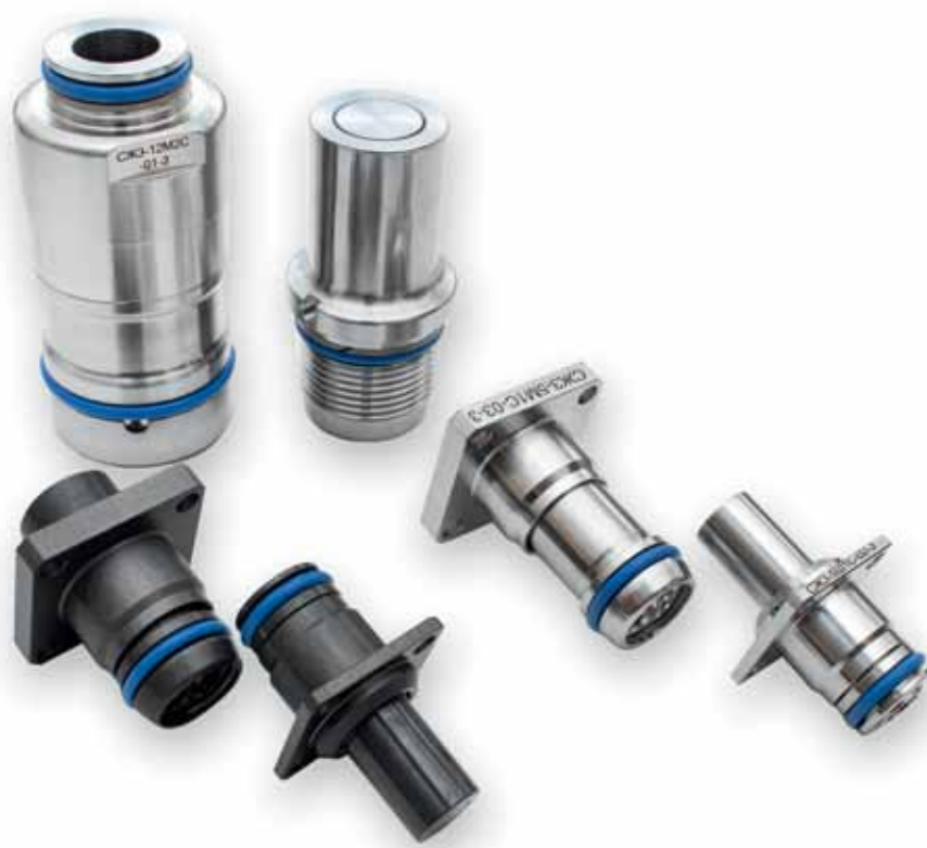
Рис. 4. Быстроразъемные гидравлические соединители типа СЖЗ

В табл. 1 приведены сравнительные характеристики БРС производства АО «Завод «Снежить».