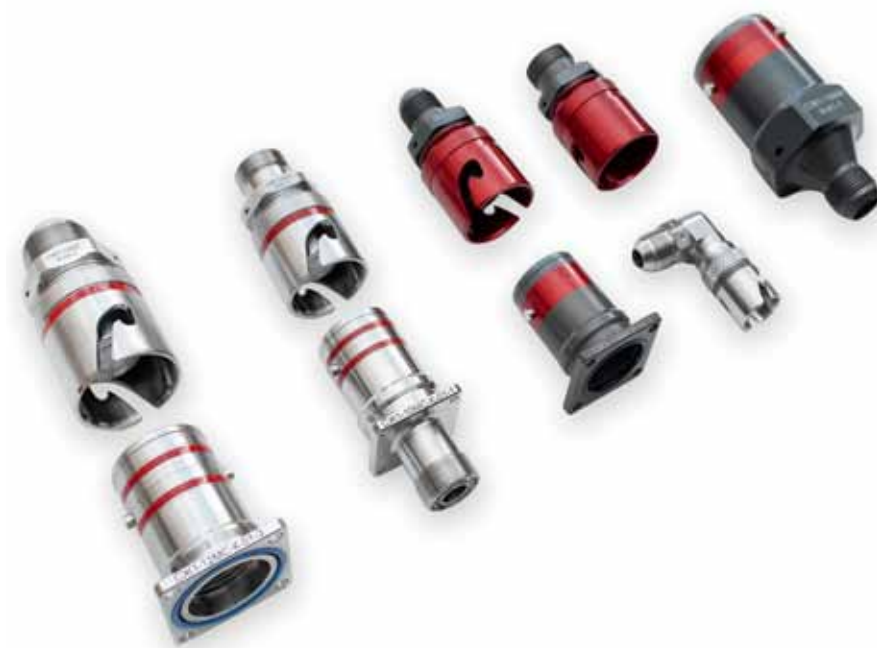
Рис. 2. Быстроразъемные гидравлические соединители типа СЖ1

Если указанные выше уплотнители не обладают достаточным сопротивлением к воздействию каких-либо веществ, используются материалы на основе этилен-пропилен-диен-моно-