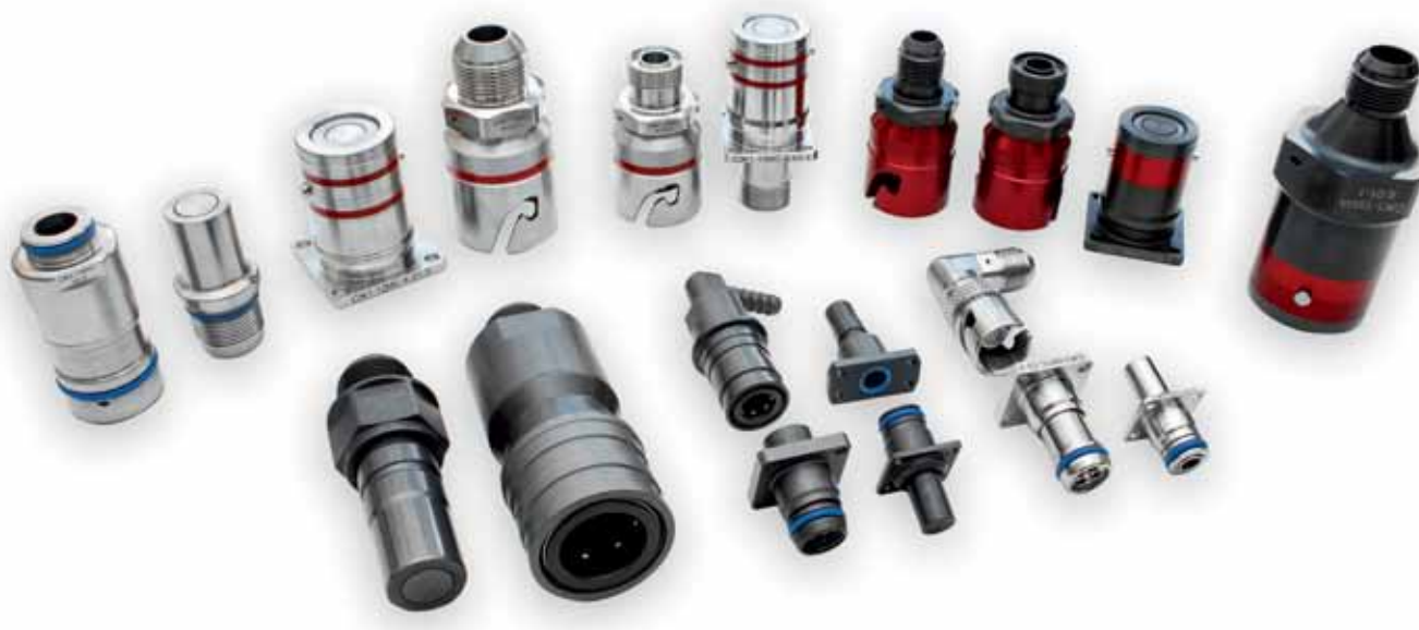
Рис. 1. Гидравлические разъемы серии СЖ производства АО «Завод «Снежесть»

Благодаря современным технологиям разъемы соединителей серии СЖ очень удобны, надежны, универсальны, а потому крайне востребованы практически во всех отраслях – от транспорта и сельского хозяйства до