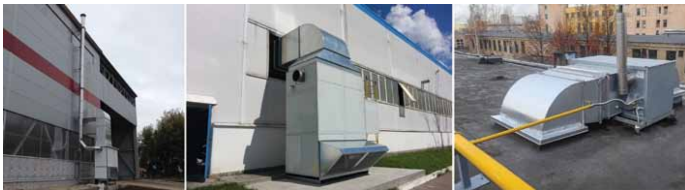
Рис. 7. Газовые тепловоздушные генераторы: наружное размещение

ИСУП: Компания «РАСКО» – очень известный игрок на рынке системной интеграции. Какое оборудование и какие сопутствующие услуги вы предлагаете для внедрения систем промышленного газового отопления?