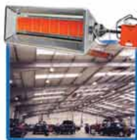
«СВЕТЛЫЕ» ГАЗОВЫЕ ИНФРАКРАСНЫЕ ОБОГРЕВАТЕЛИ