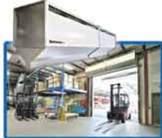
ВОЗДУШНЫЕ И ТЕПЛОВЫЕ ЗАВЕСЫ