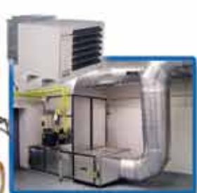
ГАЗОВОЗДУШНЫЕ ТЕПЛОГЕНЕРАТОРЫ, ОБОГРЕВАТЕЛИ И ТЕПЛОВЕНТИЛЯТОРЫ