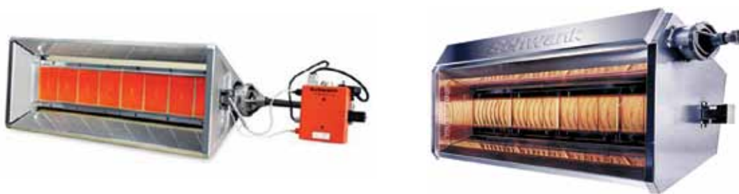
Рис. 3. «Светлые» ГИИ производства компании «Сибшванк» (Schwank) в исполнениях ecoSchwank (серия 2000) экономкласса (лучистый КПД 52 %) и supraSchwank (лучистый КПД 82,4 %)

С. А. Золотаревский: В зависимости от специфики производства могут применяться системы газового лучистого отопления с так называемыми «светлыми» (рис. 3) или «темными» излучателями (рис. 4). И те, и другие являются источниками инфракрасного излучения. Но «светлые» излучатели работают частично в видимой части инфракрасного диапазона (с длинами электромагнитных волн от 2,1 до 3,0 мкм, такие излучатели не только греют, но и светят), а «темные» – в его невидимом диапазоне (длина волн соответственно больше, свет от них не виден). Системы отопления со «светлыми» излучателями экономкласса дешевле и проще в обслуживании, однако область их применения в соответствии с требованиями нормативных документов имеет существенные ограничения. Кроме того, их применение требует наличия или создания в отапливаемом помещении эффективной системы вытяжной вентиляции для исключения попадания продуктов сгорания газа в рабочую зону. Область применения систем отопления с «темными» излучателями существенно шире. Наличие в их составе трубопроводов (фактически – дымоходов) для централизованного отвода продуктов сгорания исключает попадание последних в рабочую зону,