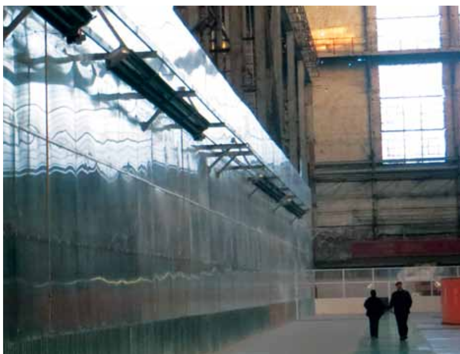
Рис. 2. Обогрев темными ГИИ с установкой ограждения из поликарбоната