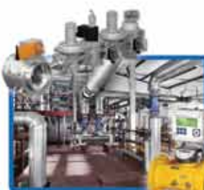
МОДЕРНИЗАЦИЯ И ПЕРЕОСНАЩЕНИЕ КОТЕЛЬНЫХ