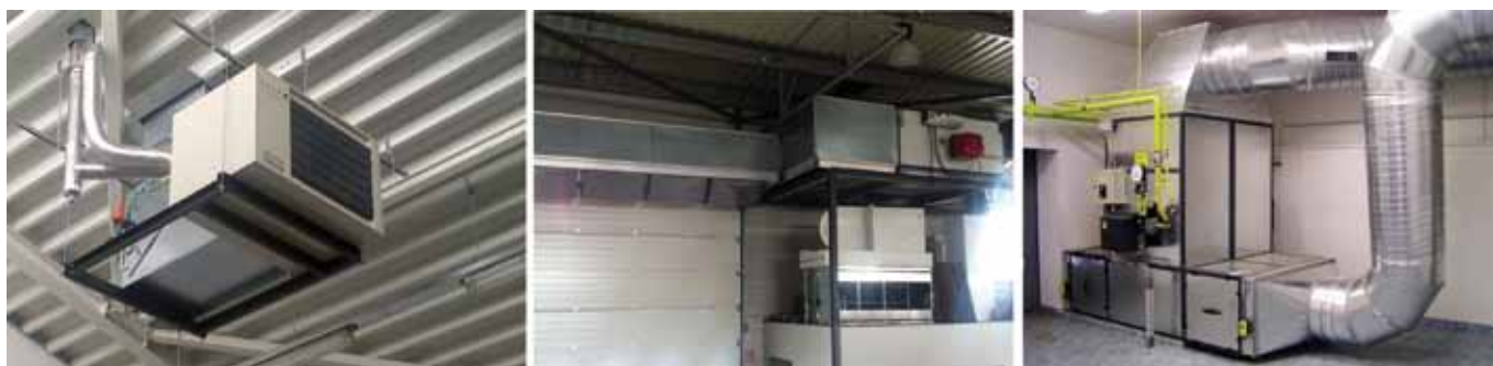
Рис. 6. Газовые тепловоздушные генераторы: внутреннее размещение