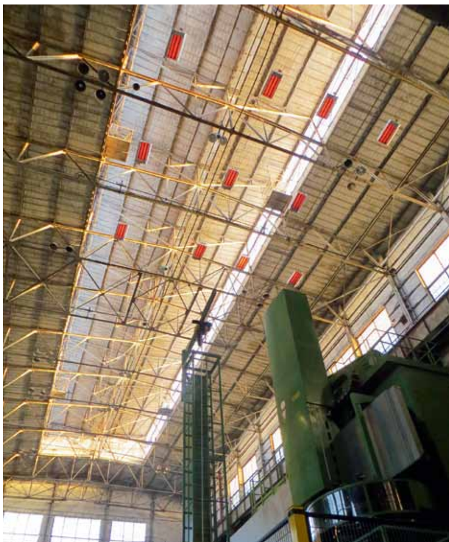
Рис. 1. Обогрев светлыми ГИИ локального участка цеха