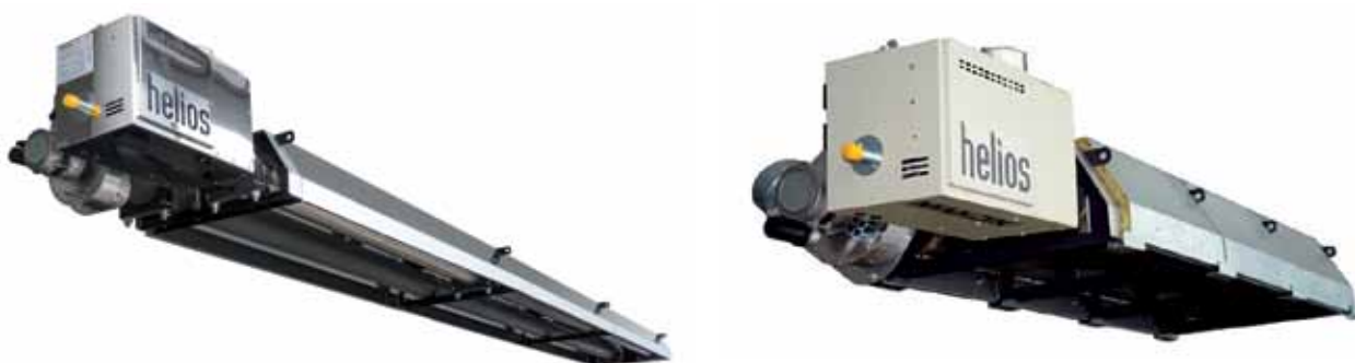
Рис. 4. «Темные» ГИИ производства компании Mandik в исполнениях Helios UD (лучистый КПД 57 %) и Helios UD+ (лучистый КПД 68 %)