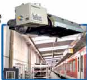
«ТЕМНЫЕ» ГАЗОВЫЕ ИНФРАКРАСНЫЕ ОБОГРЕВАТЕЛИ