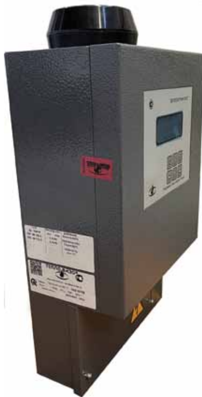
Рис. 3. Теплосчетчик ВИС.Т с QR-кодом

▶ теплосчетчик СТЭМ и тепловычислитель ИВК-59 от ПО «МЗ «Молния»;