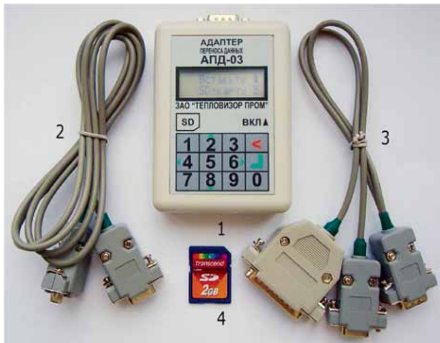
Рис. 2. Комплект поставки адаптера переноса данных АПД-03: 1 – адаптер; 2 – кабель для подключения адаптера к компьютеру или прибору; 3 – переходник; 4 – SD-карта с резервной копией установленной рабочей программы

Среди способов передачи данных, перечисленных выше, мы особо вы-