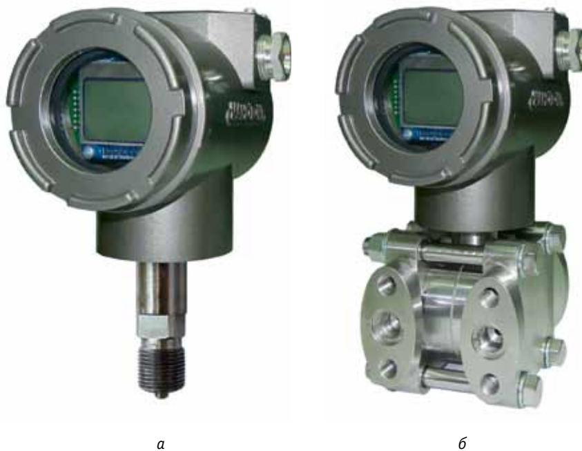
Рис. 2. Датчик дифференциального давления ДМ5017: а – штуцерное исполнение; б – фланцевое исполнение

В 2019 году ОАО «Манотомь» отобрано в Перечень производителей регионального значения и вошло в национальный проект «Производительность труда и поддержка занятости», утвержденный в 2018 году президиумом Совета при президенте Российской Федерации по стратегическому развитию и приоритетным проектам.