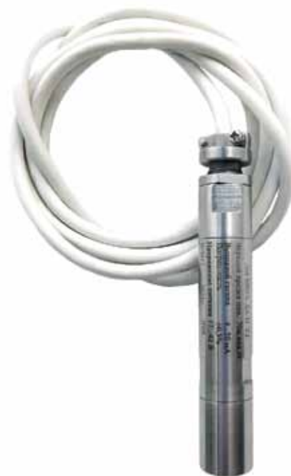
Рис. 3. Погружной датчик гидростатического давления ДМ5007А-ДА-П