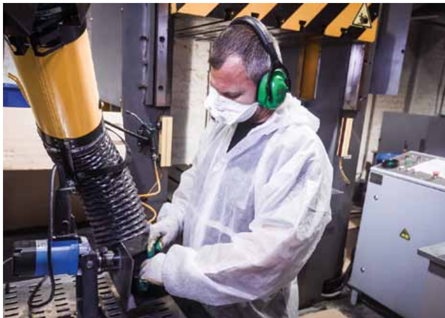
Рис. 4. «ССТЭнергомонтаж» располагает собственной производственной базой для выпуска корпусов и коробок из GRP-пластика

Взрывозащищенные корпуса ЕЕ2221 и соединительные коробки серии РТВ из GRP-пластика входят в линейку взрывозащищенного оборудования «ССТЭнергомонтаж». Ассортимент, помимо перечисленных продуктов, включает взрывозащищенные соединительные коробки из нержавеющей и конструкционной стали с видом взрывозащиты Ex e, из алюминиевого сплава с видом взрывозащиты Ex d, широкий ассортимент шкафов и постов управления Ex d и Ex e, взрывозащищенный промышленный термостат. Новая линейка оборудования в комплексе с системами электрообогрева и интеллектуальной автоматизированной системой управления ConTrace 1 составляет уникальный набор решений и компетенций для решения стратегических задач промышленных предприятий.