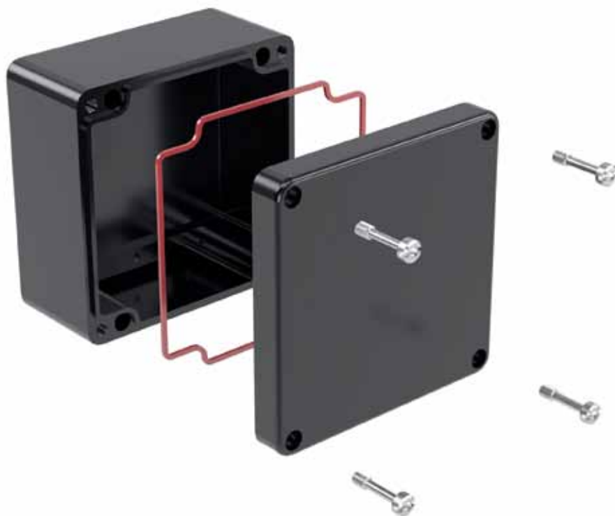
Рис. 1. Взрывозащищенный GRP-корпус EE2221 производства компании «ССТЭнергомонтаж»

Соединительные коробки из стеклоармированного полиэстера с добавлением графита активно применяются для взрывозащиты оборудования. Ком-