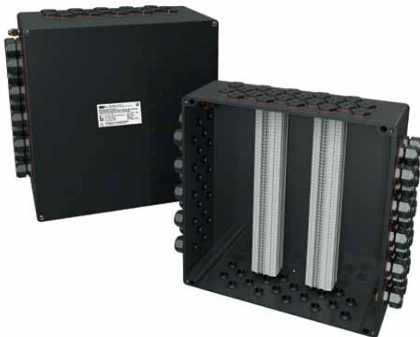
Рис. 2. Коробка соединительная РТВ-655 из GRP-пластика

Пластиковые коробки, армированные стекловолокном, компания «ССТЭнергомонтаж» выпускает на собственных производственных мощностях в Подмоскowie, постоянно контролируя в испытательном центре качество как материала корпусов и применяемых компонентов, так и го-