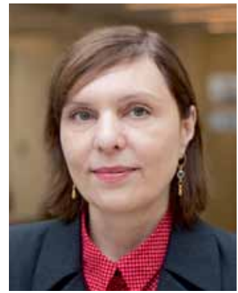
▲ Автор статьи – Екатерина Кривошей

для заказа взрывозащищенные корпуса ЕЕ2221 с маркировкой взрывозащиты согласно сертификату Ex e IIC Gb U / Ex tb IIIC Db U. Степень защиты оболочки по IEC 60529 (DIN 40050, ГОСТ 14254-96) составляет IP66/IP67, рабочий диапазон температур – от –60 до 110 °С (или –70...110 °С по спецзаказу), ударная стойкость поверхности – IK08 / 7 Дж.