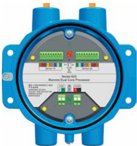
Рис. 4. Сдвоенный базовый процессор взрывозащищенного исполнения

Кориолисовые расходомеры предоставляют точные и повторяемые технологические данные в широком диапазоне расходов и в различных технологических условиях. Отсутствие подвижных деталей обеспечи-