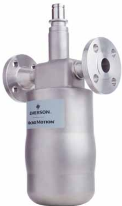
Рис. 2. Специальная конструкция сенсора, способная выдержать сложные условия циклического изменения температуры, усиливает надежность и работоспособность при использовании в криогенных средах

зовый процессор взрывозащищенного исполнения обеспечивает такие возможности, как аппаратный переключатель коммерческого учета, журнал установки нуля, возврат к заводскому нулю и сброс конфигурации (рис. 4).