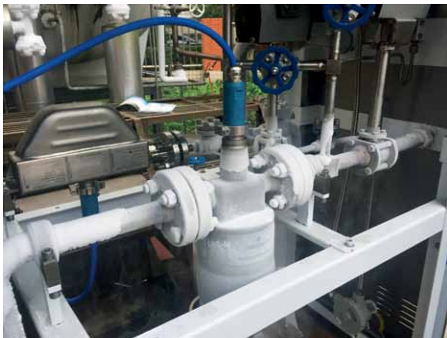
Рис. 3. Компактная конструкция сенсора позволяет экономить монтажное пространство

вает стабильную работоспособность в течение всего срока службы, что снижает затраты на обслуживание и ремонт (рис. 5). Кроме того, расходомеры Micro Motion предоставляют расширенные инструменты диагностики как самого расходомера, так и технологического процесса.