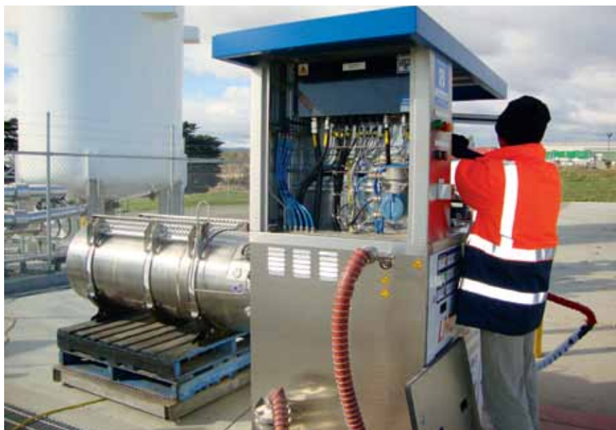
Рис. 5. Отсутствие изнашивающихся подвижных деталей обеспечивает достоверную и стабильную работоспособность в течение длительного срока эксплуатации, что снижает затраты на обслуживание и ремонт