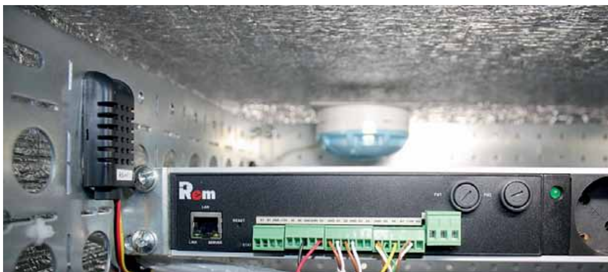
Рис. 1. Схема всепогодного шкафа с функцией удаленного мониторинга и управления

Несколько особняком стоит торговая марка Rem, потому что под ней выпускаются комплектующие для наполнения шкафов. В настоящее вре-