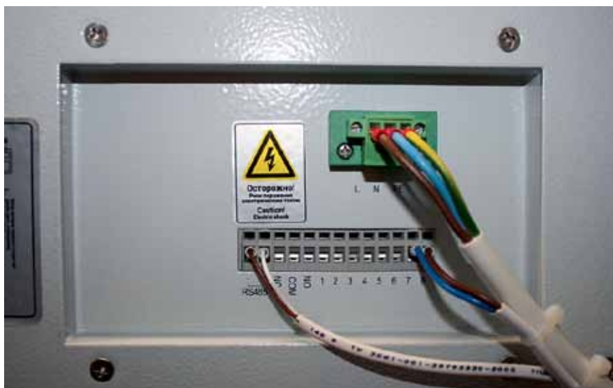
Рис. 5. Подключенный к системе мониторинга кондиционер

Телекоммуникационный шкаф Производственной группы Ремер с функциями удаленного мониторинга и управления питанием — это: