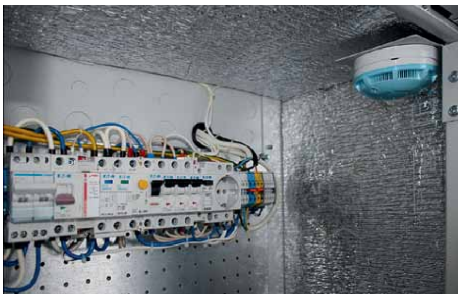
Рис. 3. ВРУ и датчик дыма