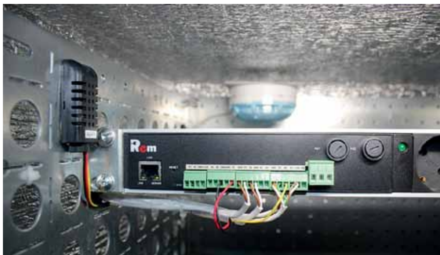
Рис. 2. Контроллер и цифровой датчик влажности и температуры RS-НТ1

С помощью контроллера Rem-МС и группы датчиков всепогодные шкафы Ремер способны осуществлять