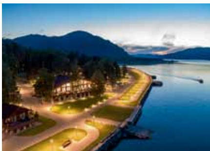
Алтайский край, СКК Altay Village АРМ «Ресурс» 110 ПУ