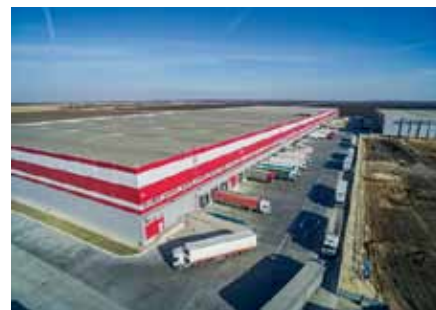
г. Ростов-на-Дону, СК Raven Russia, АРМ «Ресурс» 110 ПУ