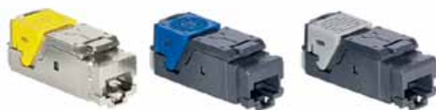
Рис. 2. Соединитель RJ45 Legrand в сборе: желтый цвет защелки – категория 6A, синий – категория 6, серый – категория 5e

Изоляция воздушных потоков в коридоре – задача, с которой ЦОД сталкивались с момента своего возникновения. Необходимо разделить потоки теплого и холодного воздуха, чтобы повысить энергоэффективность, но традиционные системы изоляции не обладают необходимой гибкостью и модульностью, чтобы обеспечить быстрое масштабирование ЦОД. Компания Minkels, входящая в Группу Legrand, в своей системе изоляции Next Generation Corridor («коридор нового поколения») первой в Европе стала применять концепцию