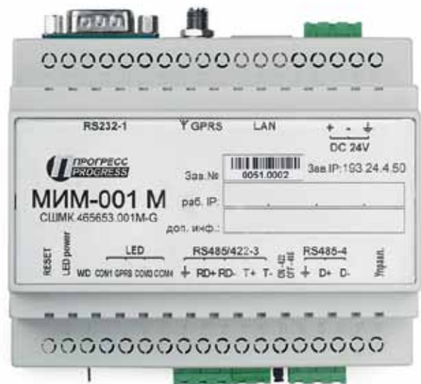
Рис. 5. Коммуникационный модуль МИМ-001

измерять сигналы постоянного тока 4–20 мА (16 каналов), считывать состояния сухих контактов и подсчитывать импульсы (32 канала), передавать команды телеуправления (2 канала), а также передавать результаты измерения по различным интерфейсам с гальванической развязкой. Аналоговые и дискретные входы защищены от импульсных перенапряжений. Четыре канала RS-485 защищены от импульсных высоковольтных перегрузок