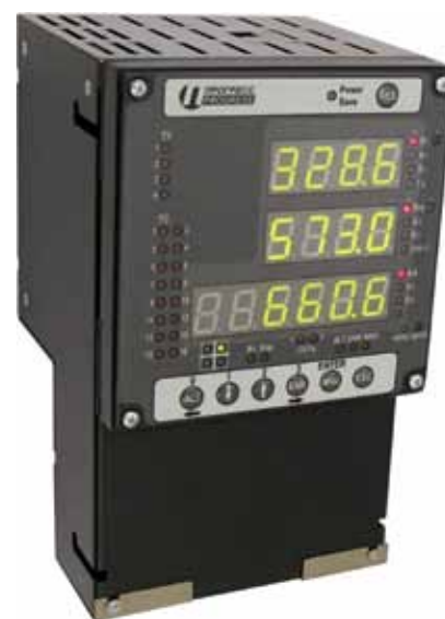
Рис. 2. Контроллер присоединения УСО-ТМ КПР

оборудование не представляется возможным. В этом случае необходимо использовать для сбора информации о нагрузке присоединения и уровне питающего напряжения установленные там раньше, до модернизации,