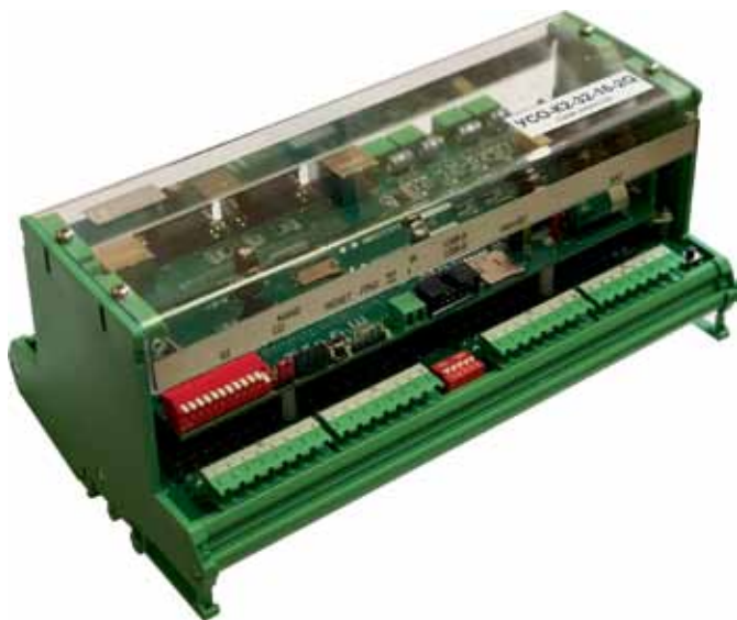
Рис. 4. Промышленный контроллер UCO-K2-32-16-2Q