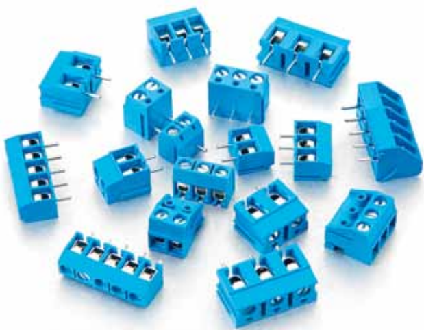
▲ Клеммники Wanjie – качественные аналоги продуктов азиатских производителей