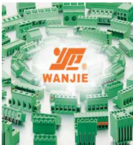
▲ Wanjie Electronic – производитель клеммных блоков на плату и провод