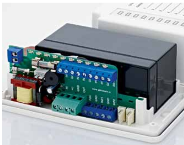
▲ Модели WJ129R, WJ301R на печатной плате

сте с новейшими станками китайский бренд постепенно перенял и европейские стандарты качества, что подтверждается сертификатами. Основа – это, конечно, ISO 9001-2000 (система менеджмента качества), сертификат соответствия техническим стандартам EAC, сертификат на выпускаемую продукцию. Также клеммы Wanjie одобрены VDE (Ассоциацией электрооборудования, электронных и информационных технологий).