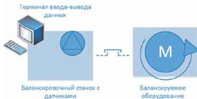
Рис. 3. Использование Raspberry Pi как управляющего модуля станка

Если раньше в дополнение к станку приходилось монтировать недорогой промышленный компьютер, то сейчас компания начала серию тестов по использованию Raspberry Pi в качестве основного управляющего модуля данного станка. Помимо того что качество Raspberry Pi отвечает необходимым промышленным стандартам, а затраты на него значительно меньше, чем на любой промышленный компьютер, компании даже не пришлось переписывать программное обеспечение, созданное для платформы Windows: на последней версии Raspberry Pi теперь можно устанавливать систему Microsoft Windows 10 и использовать практически неизменное программное обеспечение, которое применялось на промышленных компьютерах предыдущих моделей станков. В итоге компания сумела уменьшить себе-