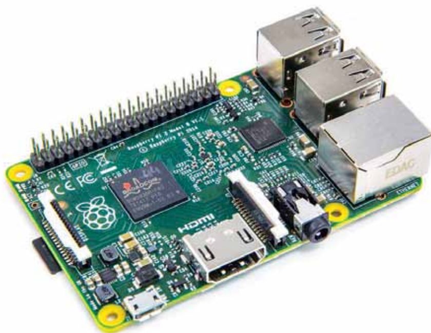
Рис. 1. Внешний вид Raspberry Pi 2 Model B

Наша компания, Awara IT Solutions ( www.awaraitolutions.com ), один