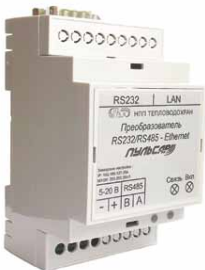
▲ Новинка от компании «Тепловодохран»: преобразователь RS232/RS485 – Ethernet «Пульсар»

Из оборудования, выпускаемого компанией «Тепловодохран», для передачи данных на дальние расстояния, применяются счетчики импульсов – регистраторы «Пульсар» со встроенным GSM/GPRS-модемом (2-, 4-канальные), GSM/GPRS-модемы «Пульсар» (2-, 4-ка-