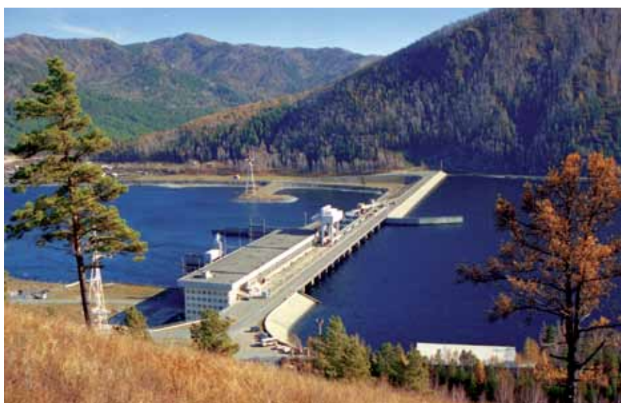
▲ Майнская ГЭС на Енисее

работоспособности установленного на нем энергетического оборудования. Одна из важных составляющих мониторинга основного оборудования – вибрационный контроль. Данные о вибрационном состоянии оборудования используются в системах