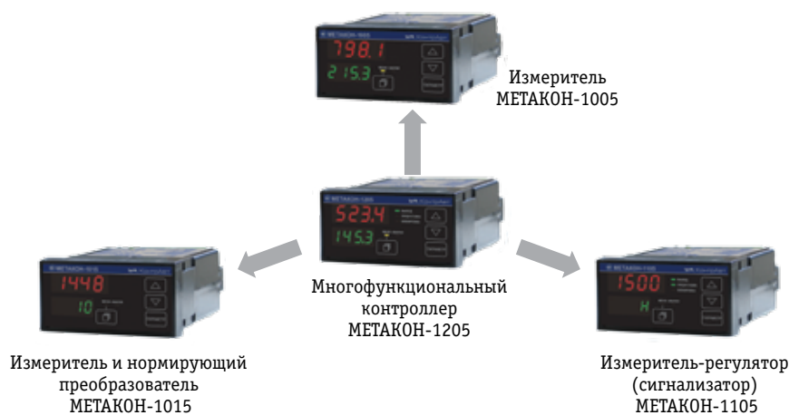
▲ Семейство приборов на платформе контроллера МЕТАКОН-1205

Устройство обеспечивает полноценный контроль над технологическим процессом, подавая сигнал, когда измеренный технологиче-