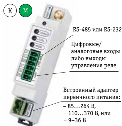
Рис. 1. ZigBee Pro-модем AnCom RZ/B. Крепление на DIN-рейку; диапазон температур: -40...+70 °C

Основная особенность технологии ZigBee заключается в том, что она позволяет строить беспроводные сети с автоматической ретрансляцией и маршрутизацией данных (ячеистая топология mesh), формируя площади сплошного информационного покрытия, при