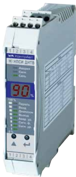
Рис. 1. Внешний вид нормирующего преобразователя действующих значений сигналов НПСИ-ДНТВ, выпускаемого НПФ «КонтраВт»

С точки зрения надежности и безопасности, в системе должна присутствовать сигнализация,