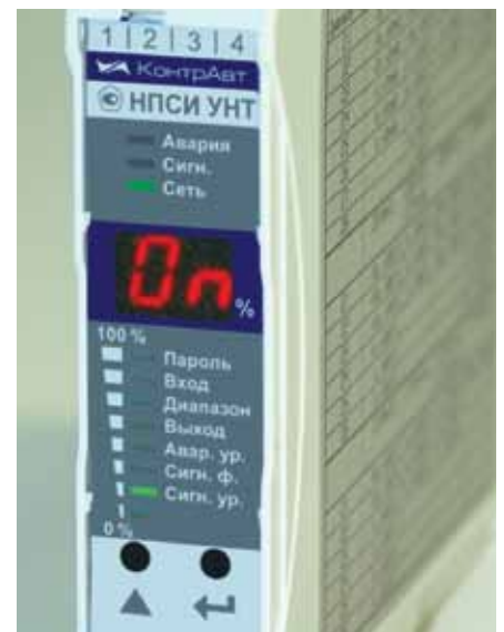
Рис. 4. Органы индикации и управления на передней панели преобразователя

Настройка преобразователя (конфигурирование) осуществляется пользователем с передней панели с помощью кнопок с контролем по цифровому двухразрядному дисплею (рис. 4). На цифровом дисплее отображается уровень сигнала в процентах от диапазона. Уровень сигнала наглядно показывает и линейный бар-граф.