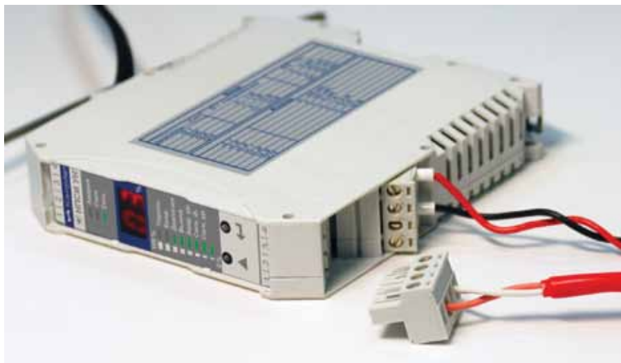
Рис. 5. Подключение внешних линий с помощью разъемных клеммных соединителей

Для удобства монтажа и обслуживания подключение внешних соединений производится с помощью разъемных клеммных соединителей (рис. 5).