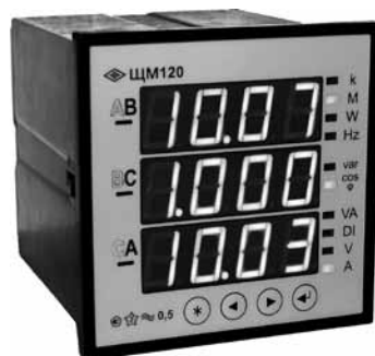
▲ Многофункциональный электроизмерительный преобразователь ЩМ120

В приборах предусмотрена возможность перепрограммирования диапазонов измерений и регулирование яркости индикации. Для повышения удобства и снижения стоимости измерения и отображения измеряемых параметров предусмотрено подключение к одному прибору через дополнительный порт с интерфейсом RS-485 нескольких модулей индикации разного вида, с поддержкой промышленной сети RS-485 и открытым протоколом обмена, для отображения измеряемых параметров режима электрической сети: фазного тока, фазного или линейного напряжения, активной и/или реактивной мощности, частоты сети и т.д. В качестве модулей индикации может выступать целый ряд панелей, выполненных в стандарт-