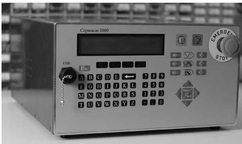
▲ Внешний вид СЧПУ СервоКон производства ЗАО «Сервотехника»