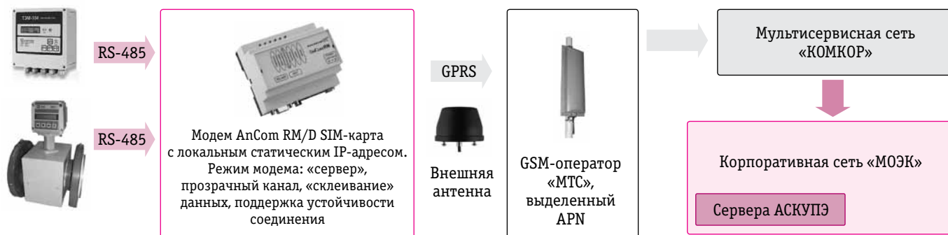
▲ Схема организации GPRS-канала АСКУПЭ

Система коммерческого учета, обеспечивающая контроль над режимами газопотребления, мониторинг состояния оборудования узла учета и охранной сигнализации. Проведены монтаж и пусконаладка первой и второй очереди: 1464 объекта в 15 регионах РФ. Получен существенный опыт применения GPRS-связи в различных регионах.