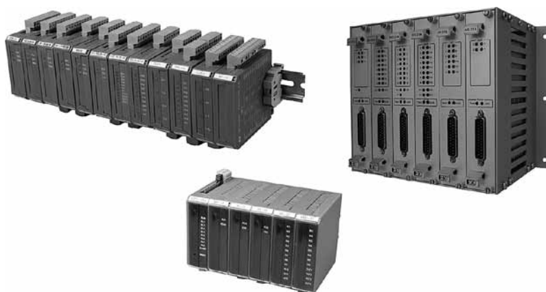
▲ Модули серий DCS-2000 и DCS-2001

В арсенале средств автоматизации компании имеются три се-