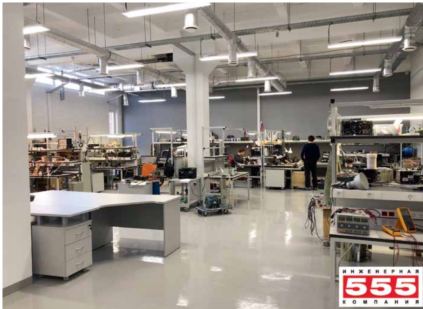
▲ Рабочий цех Инженерной компании «555»

Для того чтобы эффективно и долго использовать купленное оборудование, а не утилизировать его при любой неисправности, можно произвести ремонт на компонентном уровне, то есть найти и заменить неисправные компоненты, восстановить нарушенные связи между ними и таким образом продлить срок службы устройства. Задача это достаточно сложная, требующая как высокой квалификации инженерного состава, так и специализированного технического оснащения. Дополнительной сложностью