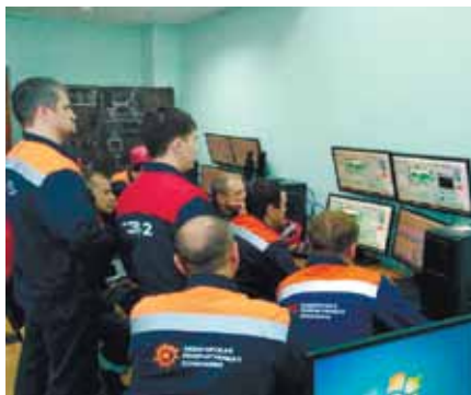
Рис. 1. Тренажер КТЦ Уфимской ТЭЦ-2

▶ иметь средства многократного воспроизведения условий заранее запланированных аварийных ситуаций,