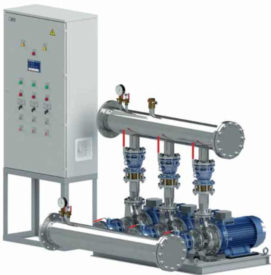
Рис. 1. Автоматизированная насосная установка «Лагуна»

щенной в серию. Появление такого решения можно объяснить, во-первых, крайне высокой востребованностью систем управления насосами, а во-вторых, большим опытом компании в создании шкафов управления насосами.