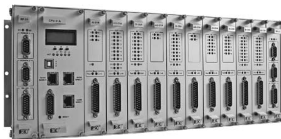
Рис. 2. Модули серии DCS-2000С

В модулях дискретного ввода, при наличии дополнительных резисторов во входных каналах, контролируется целостность полевых