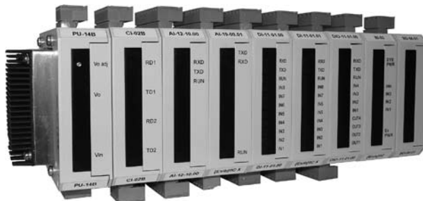
Рис. 1. Модули серии DCS-2000

По архитектуре модули серии DCS-2000, вне зависимости от конструктивного исполнения, одинаковы. Модули имеют две основные части — системную и объектную. Системная часть содержит микроконтроллер, интерфейсные каналы, обеспечивающие связь модулей УСО с модулем ЦПУ, средства адресации модуля в информационной сети и задания ско-